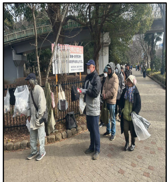
写真 2-食料を受け取るホームレスの方々